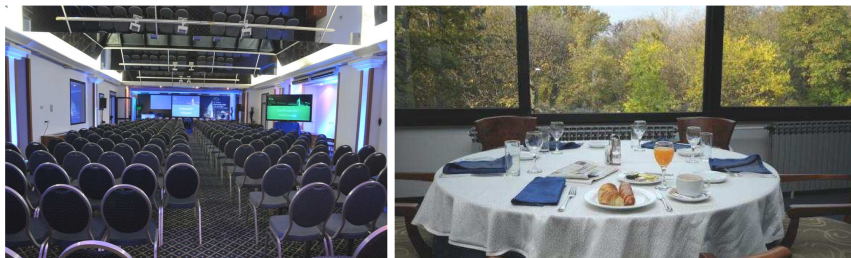
Hotel M Beograd, raspolaže odličnim salama za održavanje skupova i pruža kvalitetene ugostiteljske usluge